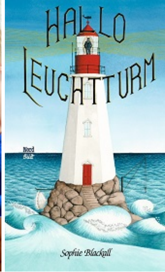
Buchcover: © NordSüd bzw. Königsfurt-Urania