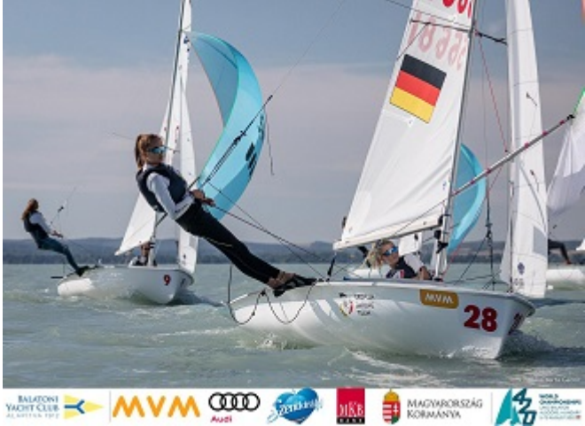
Fotos: Romeo Grobe & Moritz Peschke, EM © osga_photo; Clara Held & Johanna von Lepel (BYC), WM © Cserta Gabór