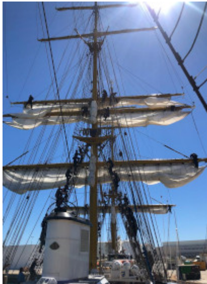
Erste Instruktionen für die Kadetten, Geburtstag des Kommandanten, Aufentern der Kadetten