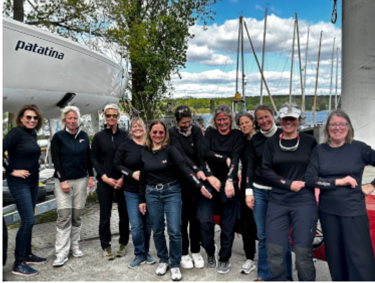
PYCahtontas in Teamkleidung :-)

Weitere Bilder finden sich auf der PYC-Homepage (https://www.pyc.de/aktuelles/berlin-ladies-cup-11-pycahontas-am-start) .